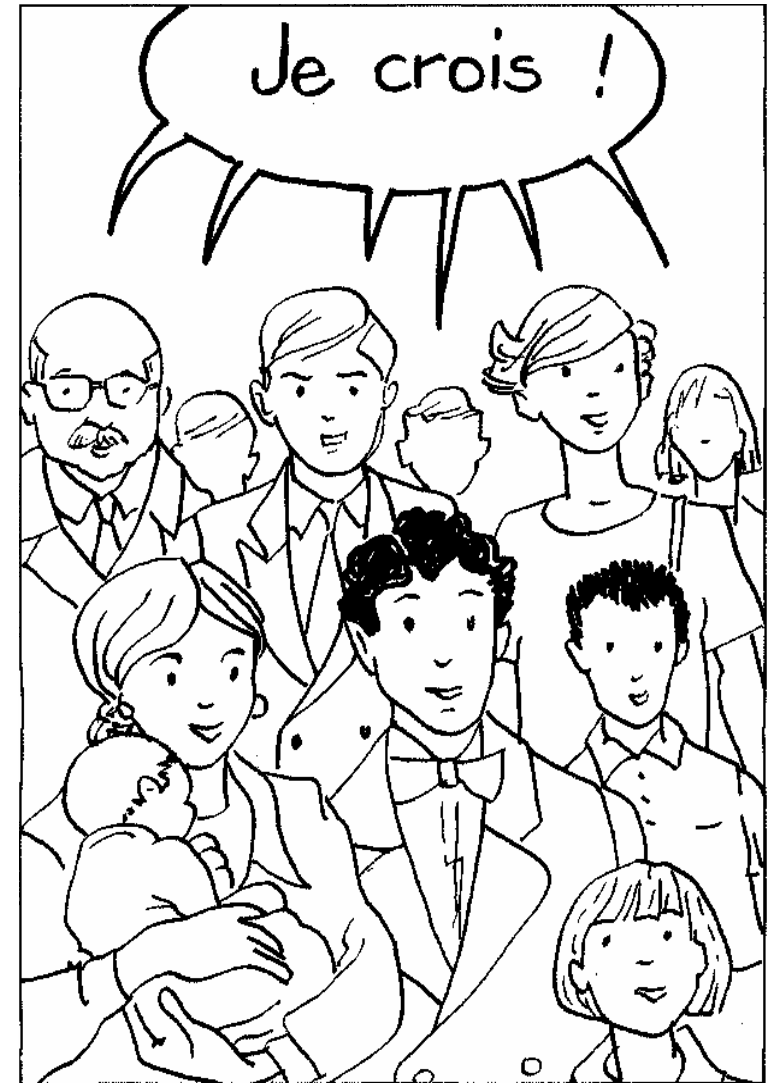
Comme Pierre ne sait pas parler, ses parents, son parrain et sa marraine disent pour lui : "Nous rejetons ce qui est mal, nous voulons faire ce qui est bien." Puis ils proclament la foi chrétienne.